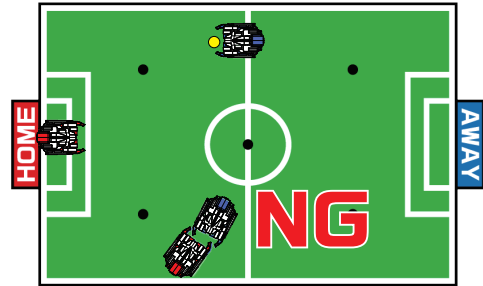
反則の例：ボールを持っていない相手を押さえつける

お 押 さ え つ け て い る 時 間 が 長 く 、 試 合 の 進 行 が と ま ま っ て し ま っ た 場 合 は 、 5 カ ウ ン ト 後 、 ド ロ ッ ポ ー ル と な り ま す。